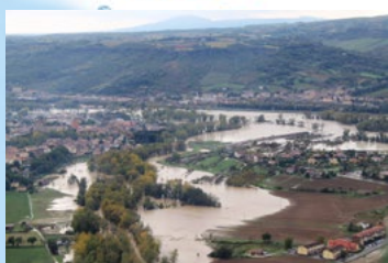
Orvieto, alluvione del Paglia