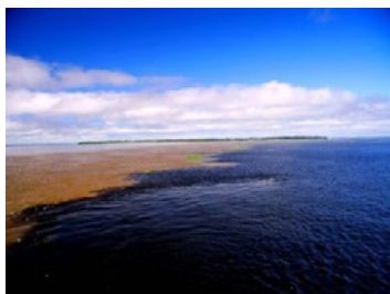
Manaus, Amazonia, sposalizio delle acque