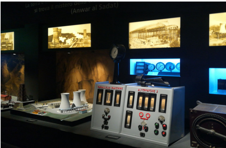
- particolare sala Museo Minerario Larderello

La visita guidata al Museo Minerario ed al Pozzo Geotermico didattico consentiranno di contestualizzate gli argomenti nel territorio specifico del Convegno.