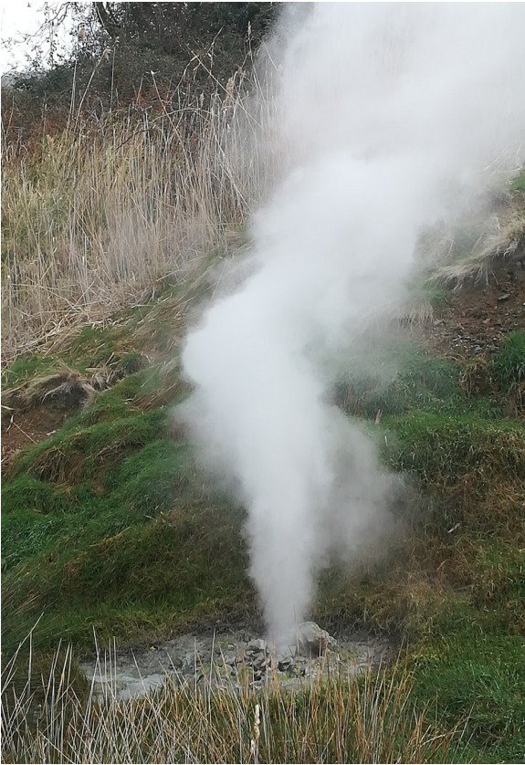
- Emissioni di vapore - Parco delle fumarole a Sasso Pisano

L'impiego del vapore naturale per la produzione energetica venne intrapreso da Francesco Larderel, che nel 1827 cominciò ad impiegare le peculiari emissioni per l'alimentazione delle caldaie per l'estrazione dell'acido bórico.